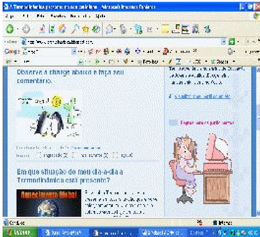
Figura 2 – Charge colocada no Blog

tadual da Paraíba), em Campina Grande. A professora solicitou à turma que desenvolvesse um blog para ser utilizado com nossos alunos 1 , com o objetivo de desenvolver elementos que estimulem o processo de ensino e aprendizagem utilizando ambientes virtuais.