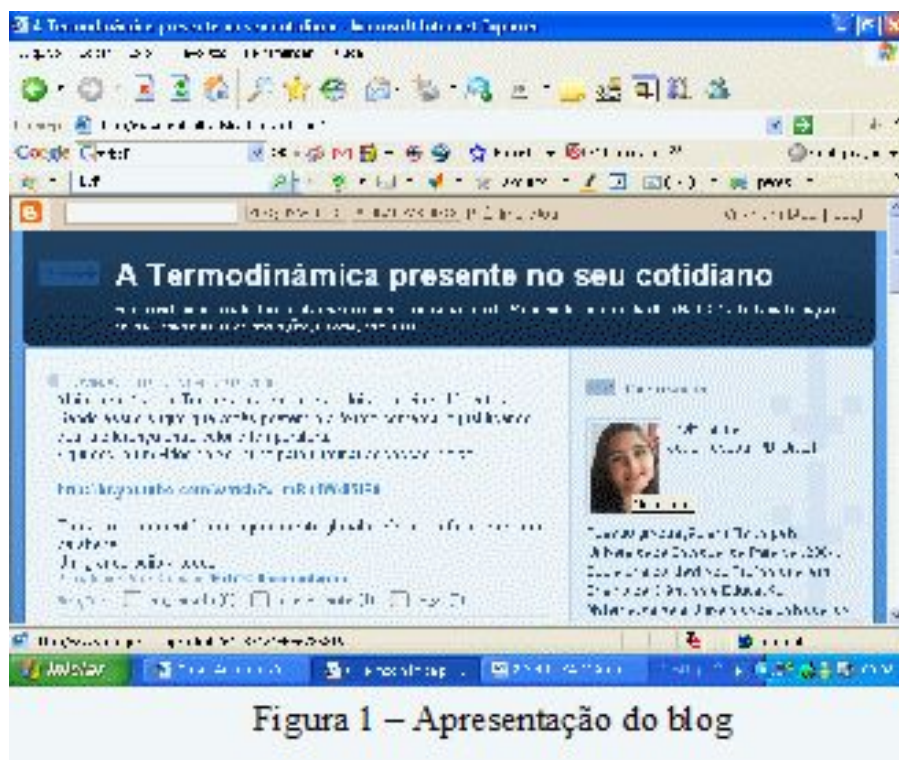
Figura 1 – Apresentação do blog

Este estudo começou em setembro de 2008, numa vivência que teve como objetivo fornecer subsídios sobre a importância dos ambientes virtuais de aprendizagem, na disciplina Ambientes Virtuais e Colaborativos de Ensino-aprendizagem, do Mestrado Profissional em Ensino de Ciências, da UEPB (Universidade Es-