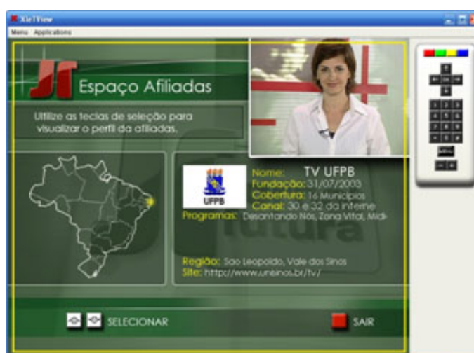
Figura 13: Tela de informações do recurso interativo “Espaço Afiliadas”.