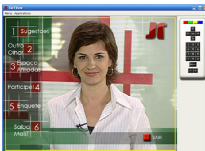
Figura 1: Tela do menu principal do JF interativo.

No aplicativo, existem recursos como “Saiba Mais” e “Entrevista”, que ficam disponíveis de acordo com o que acontece na exibição do telejornal. As funções são anunciadas pela apresentadora do JF. A fim de garantir uma usabilidade eficaz, procuramos manter características que facilitam a navegação do usuário no aplicativo. Para isso, buscamos relacionar os nomes dos recursos às funções que eles executam, partindo do pressuposto de Nielsen (1993) citado por Monteiro (2002), que afirma: a usabilidade é composta de múltiplos componentes, sendo associada a cinco atributos: facilidade de aprendizado, eficiência de uso, fácil memorização, poucos erros e sensação de satisfação. [NIELSEN 1993 apud MONTEIRO 2002]