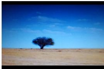
Figura 4– Árvore solitária como alegoria

Nesse mesmo sentido, também podemos ler o plano-sequência feito sobre a árvore solitária na cena em que Hermila volta do motel depois de finalizar a idéia de rifar-se. A câmera subjetiva, nos passando o olhar de Hermila de dentro do carro, mostra uma paisagem de céu amplo e limpo e somente uma árvore em meio ao terreno árido, sem nenhuma vegetação a mais ao seu redor. Bem como os fios elétricos, a árvore também representa um lugar de vida, de movimento, mas permanece estática, parada, assim como Hermila, cheia de vida, mas estagnada em um lugar árido para ela.