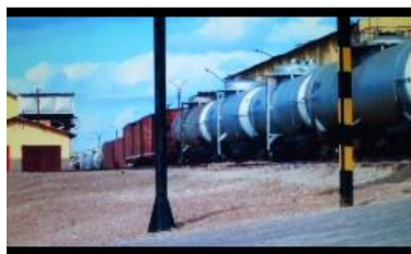
Figura 1– Trem em O céu de Suely