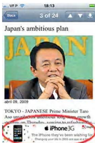
Figura 9: Noticia en un periódico de Singapur (The Straits Times)

Analizando nuestro objeto de estudio por medios, el 41% de las televisiones, el 39% de los periódicos y el 17% de las radios explotan