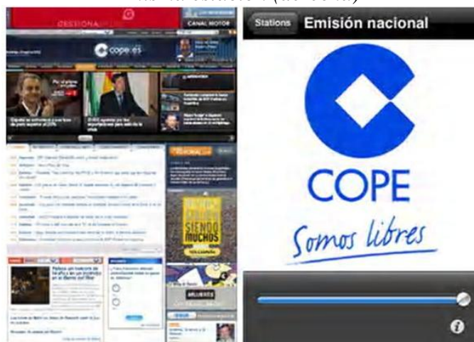
Figura 11: Sitio web de COPE (izquierda) e aplicación iPhone de la misma estación (derecha)

La escasa presencia de la hipertextualidad y la opción por una multimedialidad por yuxtaposición podrá explicarse por la pequeña dimensión de la pantalla de un smartphone que dificulta la navegación digital entre enlaces y la integración de vídeos en el texto de la noticia.