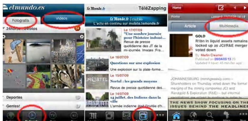
Figura 10: Ejemplos de multimedialidad (vídeo)

Las radios se apartan del modelo de convergencia multimedia que presentan en sus versiones Web donde ofrecen vídeo, texto y fotos junto con el sonido. El ejemplo de COPE (figura 11) ilustra este regreso a un modelo más cercano a su versión hertziana tradicional.