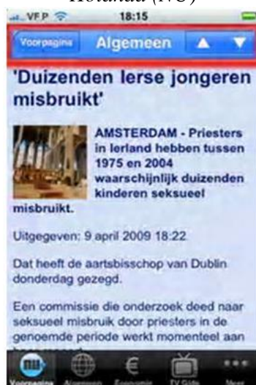
Figura 7: Menú superior del campo noticia de un periódico de Holanda (NU)

En determinados casos, esta posibilidad está encuadrada en un menú de navegación más completo que permite avanzar y volver: ▲▼ (33%) y ◀▶ (15%). La posibilidad de envío de la noticia es otra opción presente en el 8% de las aplicaciones.