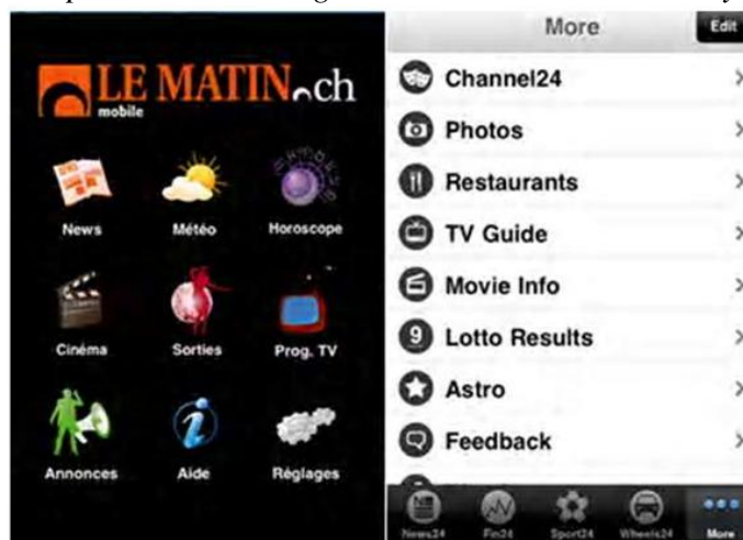
Figura 12: Aplicaciones de la geolocalización en Le Matin y 24 Horas

Los anuncios, la programación de cine y los restaurantes son tres ejemplos de posibles fuentes de ingresos para las empresas de comunicación que disponen de este tipo de aplicaciones.