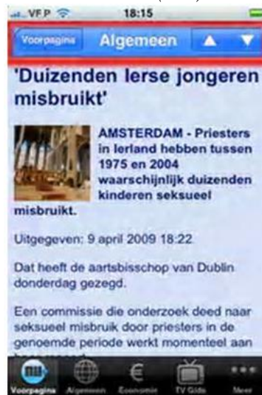
Figura 7: Menú superior del campo noticia de un periódico de Holanda (NU)

En determinados casos, esta posibilidad está encuadrada en un menú de navegación más completo que permite avanzar y volver: ▲▼ (33%) y ◀▶ (15%). La posibilidad de envío de la noticia es otra opción presente en el 8% de las aplicaciones.