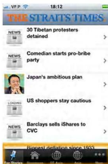
Figura 5: Menú inferior de un periódico de Singapur

El número y tipo de secciones más habitual es de 4 (73%), pero se pueden encontrar entre 2 y 19 otras secciones (figura 6).