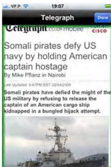
Figura 8: Noticia en un periódico de Inglaterra (Telegraph)

La hipertextualidad en la noticia es una característica casi inexistente: solamente en el 6% de los casos se utilizan enlaces en los textos de las noticias. El nombre del periodista está en tan sólo el 2% de las noticias, limitando el contacto usuario-periodista.