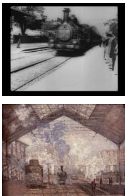
Fig. 1 Lumière, A chegada de um comboio Monet, La Gare Saint-Lazare , 1877

Godard faz dizer a uma personagem interpretada por Jean-Pierre Léaud em La Chinoise (1967), que Lumière era «um pintor», «o último pintor impressionista». Ao dizer isto, Godard não considerava Lumière como o inventor de um aparelho capaz de reproduzir a realidade, mas uma artista, um produtor de efeitos de realidade. Em 1998, em Histoire(s) du Cinéma , Godard retoma, dizendo: «[...] com Edouard Manet começa a pintura moderna, quer dizer, o Cinematógrafo».