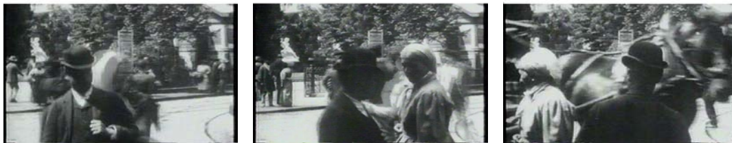
Fig. 3 Filme dos irmãos Lumière Fotogramas 1, 2, 3 – Quando o acaso encontra a objectiva

estão a ver e a ser vistos pelo “cine-olho” 1 e pelo “olho humano”, modificam os seus comportamentos. Encenam-nos. A encenação escapa ao operador do cinematógrafo.