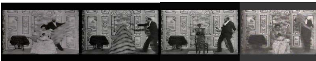
Fig. 5 L'escamotage d'une dame chez Robert-Houdin (A dama desaparecida) Georges Méliès, 1896

Este acaso, devido à paragem acidental do aparelho, foi utilizado pouco tempo depois no seu filme L'Escamotage d'une Dame chez Robert-Houdin (A dama desaparecida). A dama sentada numa cadeira era coberta por um lençol. No momento seguinte, Méliès imobiliza a imagem. O operador pára de filmar. A dama sai debaixo do lençol. Pode-se observar o canto do vestido acidentalmente deixado a descoberto por Méliès. A câmara recomeça então a filmar. A dama desapareceu. Este truque simples de realizar serve, de certa forma, para libertar o cinema do tempo real, visa provocar uma ruptura narrativa, que produz um efeito de surpresa no espectador e não um sentido.