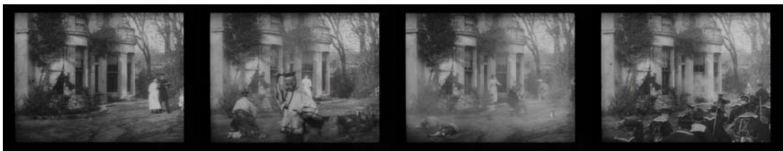
Fig. 6 Attack on a China mission Williamson, 1900

A Escola britânica de Brighton começou desde 1900 a fazer a reconstituição de actualidades. Attack on a China mission (1900), uma actualidade reconstituída de um episódio da guerra dos Boxers, cujo autor é Williamson. Os Boxers perpetraram um ataque a uma missão, o pastor é morto e a sua esposa pede auxílio a marinheiros britânicos dirigidos por um oficial que salva por um triz a filha do pastor em vias de ser raptada. Trata-se da primeira narrativa cinematográfica.