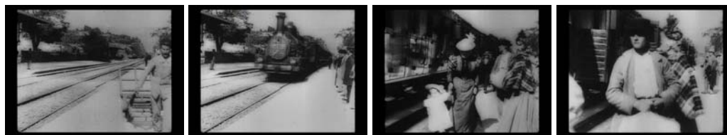
Fig. 2 Fotogramas de A chegada de um comboio na estação de La Ciotat , 1896

O comboio pára na estação e os passageiros descem de uma carruagem, enquanto umas pessoas os esperam no cais e outras aguardam o momento de entrarem. Novo contraste. Agora entre as pessoas que estão no cais: umas burguesas, outras pertencentes ao povo.