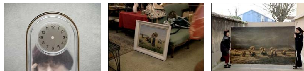
Les glaneurs et la glaneuse , Agnès Varda Fotogramas 4, 5, 6 - Respiga de objectos peculiares

unidade temática, uma sequência, mas a desvelarem a subjectividade e sensibilidade de Varda, que se serve da sua pequena câmara DV não como instrumento invisível para mostrar o que observa de forma objectiva, que tem a «tentação fantasmática da objectividade» (Piault, 2000) tal como acontecia nos anos 1960 com o cinema directo 18 (cinema-verdade, Jean Rouch) de suprimir a presença do observador mostrando o outro, o objecto de observação, sem um intermediário; mas como um medium que regista o real pro-filmico, uma tecnologia nas mãos da realizadora – no ecrã, dentro do enquadramento – enquanto instrumento privilegiado da respiga e da própria respigadora, que se filma a si mesma, sem narcisismo, no processo reflexivo de se observar a filmar observando a mão no acto de filmar a outra mão.