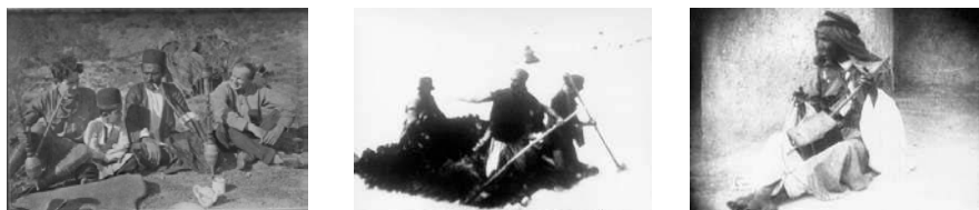
Fig. 7 Grass: A Nation Battle for Life Merian C. Cooper e Ernest B. Shoedsack, 1925

A intenção de Cooper e de Shoedsack de encenar e de criar uma ficção, através da presença da jovem jornalista no enquadramento, cai rapidamente e quanto mais o filme avança mais problemáticas e perigosas se tornam as condições de realização devido às dificuldades que os próprios Bakhtyari enfrentam, decorrentes de um problema político ocorrido no sul do Irão. Os acasos (causas, conjuntura política) da rodagem levam-nos a pôr de parte o dispositivo filmico previsto e a improvisar para conseguirem captar imagens do acontecimento. “A causalidade aparece como sendo apenas uma cor mental, que recebem alguns graus de probabilidade numa sucessão de fenómenos em que é perfeitamente indiferente, e aliás impossível, saber se são, de outra maneira, independentes ou dependentes uns dos outros” (Epstein, 1946: 92-93). Esquecem a ficção. Representam o quotidiano destes pastores e a jornalista passa a ser uma mera personagem entre outras. O observador já não é alguém que está no exterior a observar, passa a ser um experimentador que participa na acção. “ [...] a realidade ultrapassa a ficção à qual abre uma via, introduzindo na construção inicial a parte do acaso que dá forma à tensão narrativa. O observador prevenido (cineasta e/ou antropólogo) é assim submetido à obrigação de se submeter às condições da situação já não observada mas partilhada” (Piault, 2000: 86-87).