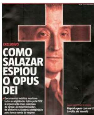
Fig. 5 – Capa da revista Sábado , de Portugal. A ilustração fotográfica intensifica o obscurecimento das fronteiras do fotojornalismo.