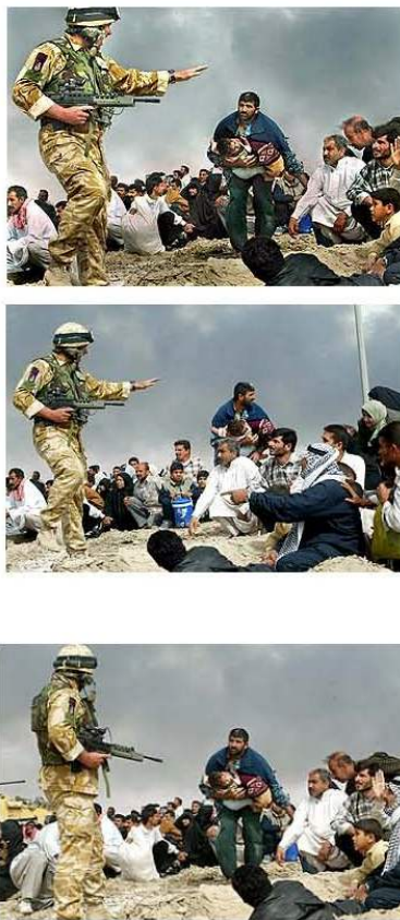
Fig. 9, 10 e 11 – Em Março de 2003, o fotojornalista Brian Walski, do Los Angeles Times , usou duas fotos para fabricar virtualmente a primeira imagem. Foi demitido, pois os valores jornalísticos implicam o compromisso referencial do jornalista com a realidade.

Não é que as imagens virtuais não possam ser usadas em fotojornalismo. Podem. Mas desde que sirvam melhor o propósito informativo e o leitor seja avisado que está perante um cenário fictício (Sousa, 2004a; 2004b). É possível que na imprensa coexistam vários tipos de imagem, em equilíbrio, desde que as suas finalidades não se confundam.