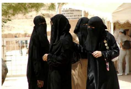
Fig. 8 – Esta imagem é iconográfica, referencial e “verdadeira”, mas também redutora e estereotipada e, neste sentido, “virtual”. Nela, a mulher muçulmana é reduzida às suas vestes.

A permeabilidade entre os diferentes géneros e formatos fotográficos, agudizada e crescentemente facultada pela digitalização, gera também o recurso às técnicas de persuasão imagética próprias da publicidade e da propaganda por parte da fotografia jornalística. A estereotipização de sujeitos (Sousa, 2006) ou o abandono da função referencial que deve presidir à fotografia jornalística nas imagens digitalmente manipuladas (Sousa, 2004a; 2004b), por exemplo, transferem para o terreno do virtual o que deveria estar no terreno do real.