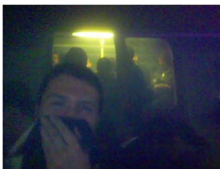
Fig. 16 – As fotografias do cidadão repórter, como estas dos atentados terroristas islâmicos no metro de Londres, serão fotojornalismo, ou o fotojornalismo deve ser restrito à ideia de actividade desenvolvida por profissionais devidamente remunerados e submetidos a leis, códigos e convenções editoriais?

Para ampliar o debate sobre o que é o fotojornalismo, uma outra questão deve colocar-se. Será necessário ser-se fotojornalista para se fazer fotojornalismo? Terá a actividade de ser forçosamente conotada com uma actividade profissional, desenvolvida por profissionais? Ora, da mesma forma que um indivíduo que arranja a torneira de casa não é forçosamente um canalizador, também o cidadão ou mesmo o “jornalista cidadão” que produz ocasionalmente, por vezes com um mero telefone celular, umas fotografias com interesse noticioso não será um fotojornalista. Um fotojornalista não o é apenas por ter um cartão que o identifica enquanto profissional e jornalista e por ser remunerado pelo seu trabalho. Um fotojornalista submete-se a leis, códigos, linhas editoriais e convenções noticiosas a que o “cidadão repórter” não precisa de se submeter ou até, muitas vezes, nem sequer necessita de conhecer.