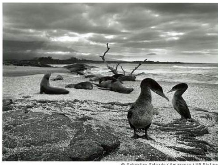
Fig. 15 – Fotografia do projecto Génesis, de Sebastião Salgado. Serão os projectos fotodocumentais uma forma de fotojornalismo?

isso fotojornalismo? Ou ainda, se reparar em ilustrações fotográficas, igualmente fabricadas por fotojornalistas para publicação na imprensa. É fotojornalismo?