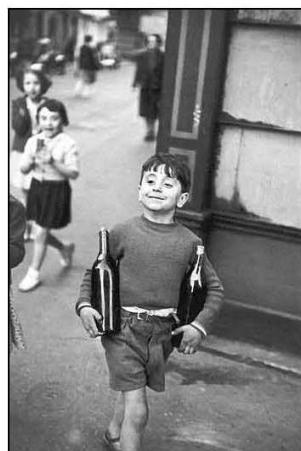
Fig. 13 e 14 – A enorme diversidade de imagens que se podem reivindicar como pertencendo ao campo do fotojornalismo torna difícil categorizar a actividade e o que é uma fotografia jornalística. Estas duas imagens, a primeira do projecto FSA (Mãe Migrante, de Dorothea Lange) e a segunda de Henri Cartier-Bresson (rue Mouffetard, Paris), exemplificam a complexidade dessa classificação.