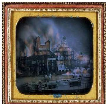
Fig. 1 – Coloração artificial de fotografias de notícias – prática comum de manipulação destinada a emprestar realismo às imagens.

De facto, enviado para a Crimeia, em 1855, para cobrir a guerra que opunha uma coligação franco-britânica aos otomanos, Fenton recebeu instruções para não mostrar a face cruel da guerra. Fotografou o conflito com um enfoque positivo. As suas imagens não mostram mortos (melhor dizendo, uma só, censurada, mostra mortos inimigos alinhados), mas apenas jovens garbosos nos seus uniformes. Numa única imagem, um ferido sorridente é carinhosamente socorrido; noutra, balas de canhão juncam o campo de batalha, sendo a única que sugere, sem mostrar, que a violência esteve presente durante o conflito.