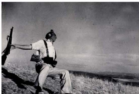
Fig. 12 – Esta célebre foto de Robert Capa indicia as condições da sua produção, é um ícone do momento da morte de um soldado republicano durante a guerra civil de Espanha e é um símbolo da morte na guerra. A fotografia jornalística pode ser índice, ícone e símbolo, simultaneamente.

A fotografia é, de facto, um sistema expressivo complexo, podendo funcionar como índice, ícone ou símbolo. A célebre foto de Capa da morte de um soldado republicano durante a Guerra Civil de Espanha, cuja autenticidade ainda hoje se discute, indicia as condições da sua produção e autoria, referencia o acontecimento e tornou-se símbolo da morte na guerra.