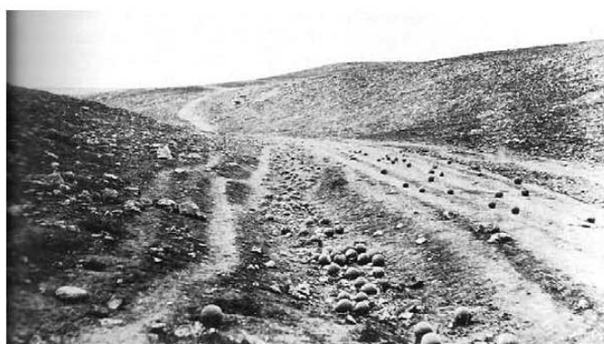
Figs. 2 e 3 – Roger Fenton, 1855, Crimeia. Fotografias que não mostram a face cruel da guerra.

Assim sendo, pode dizer-se que o fotojornalismo, desde que surgiu, ofereceu à contemporaneidade uma vasta gama de fotografias-problema que chamam a atenção para o estatuto da imagem fotojornalística e da própria actividade. Equacionar esse estatuto ganha particular dimensão devido à enorme profusão de fotos que são quotidianamente usadas com fins jornalísticos. O objectivo desta reflexão é, assim, o de contribuir para problematizar o estatuto da imagem fotojornalística e do fotojornalismo enquanto actividade profissional.