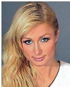
Fig. 4 – Mugshot de Paris Hilton: o fotojornalismo, em especial no retrato, vai buscar à publicidade e mesmo à fotografia utilitária modelos de expressão.