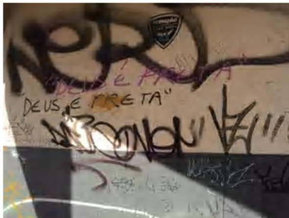
Figura 4 – Registro feito pela autora, 2012

Na Figura 5, há apenas uma imagem tratando de questões de religiosidade, sacro, ligado a conceitos da estética da pop art, profano. É um estêncil pequeno, inscrito várias vezes ao longo da rua. Compõe com outras imagens.