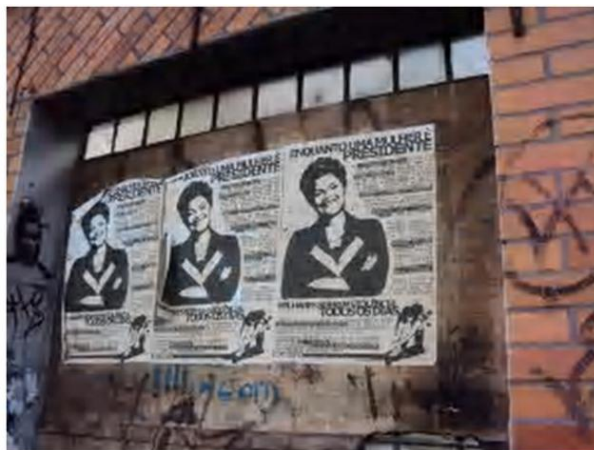
Figura 6 – Registro feito pela autora, 2012

tempo em que cita dados e argumentos em relação à violência. Há várias colagens ao longo da quadra mais movimentada no período da noite, que vai da rua Inácio Lustosa a rua Paula Gomes.