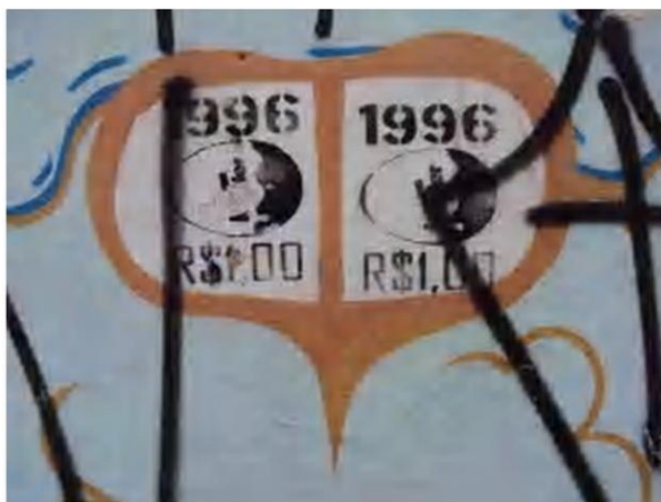
Figura 2 – Registro feito pela autora, 2012

Na segunda inscrição (Figura 2), o questionamento sobre as leis de mercado mostra a passagem do tempo e o encarecimento de produtos. É um estêncil que se repete várias vezes ao longo da rua. Infere-se ainda sobre a idade jovem dos produtores, uma vez que a crítica é realizada com argumento de um produto alimentício infantil.