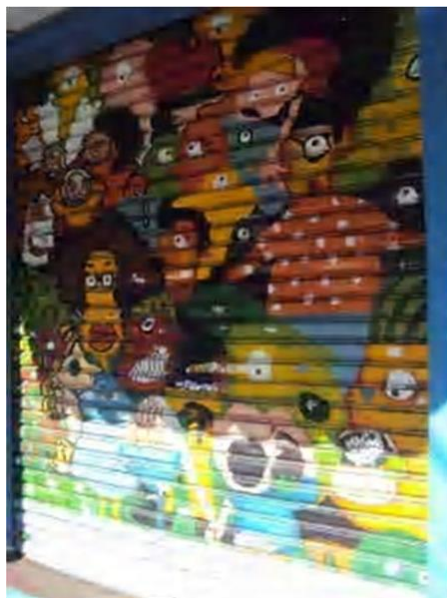
Figura 15 – Registro feito pela autora, 2012

Como há muita informação circulando, há também na intervenção espaço para divulgar a arte, como literatura (Figura 16), além da expressão gráfica. Foi registrado apenas um stick com conteúdo literário, com uma poesia chamada “Suicídio Social”. Há outras inscrições que tratam de chamadas a eventos de literatura, música, cinema e teatro. Porém, nenhuma apresenta o produto artístico, além da expressão gráfica, servem apenas como convite.