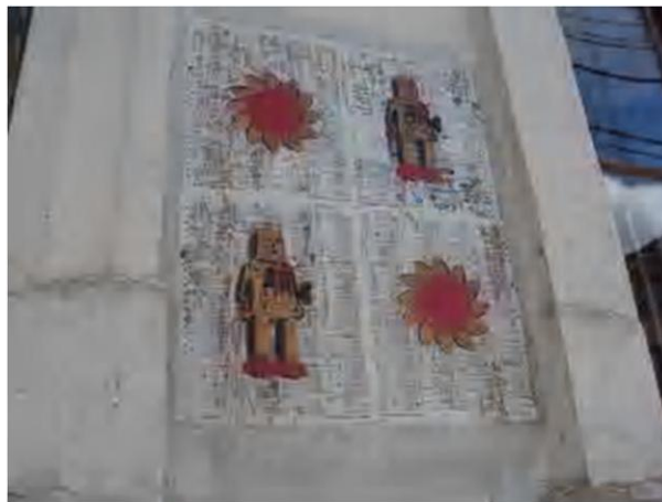
Figura 1 – Registro feito pela autora, 2012

Na segunda inscrição (Figura 2), o questionamento sobre as leis de mercado mostra a passagem do tempo e o encarecimento de produtos. É um estêncil que se repete várias vezes ao longo da rua. Infere-se ainda sobre a idade jovem dos produtores, uma vez que a crítica é realizada com argumento de um produto alimentício infantil.