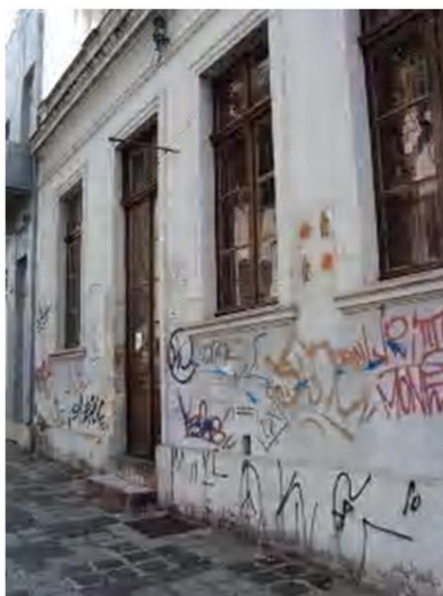
Figura 8 – Registro feito pela autora, 2012

Os traços e as cores são diferentes e, com a passagem do tempo, aumentam em número ao longo da rua. Variam entre tags pequenas e inscrições semelhantes a frases cifradas e coexistem, ainda, com outras