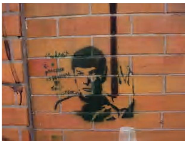
Figura 12 – Registro feito pela autora, 2012