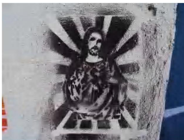
Figura 5 – Registro feito pela autora, 2012

Na Figura 5, há apenas uma imagem tratando de questões de religiosidade, sacro, ligado a conceitos da estética da pop art, profano. É um estêncil pequeno, inscrito várias vezes ao longo da rua. Compõe com outras imagens.