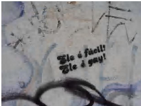
Figura 11 – Registro feito pela autora, 2012