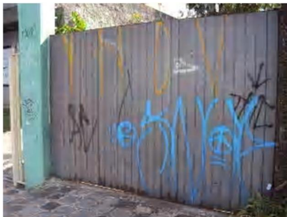
Figura 7 – Registro feito pela autora, 2012