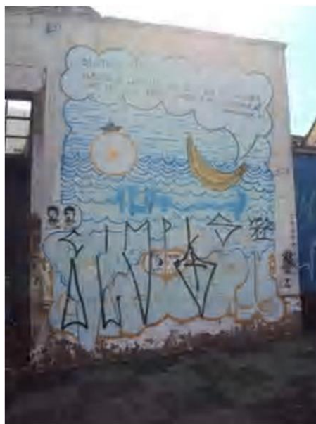
Figura 9 – Registro feito pela autora, 2012

Na figura 9, observa-se um grafite complexo e composto de escritas e desenhos, além de pichações feitas sobre o desenho. Ao longa da fachada ainda há estêncis que não estão diretamente sobre o desenho, mas ocupam espaços em branco do mesmo.