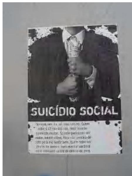
Figura 16 – Registro feito pela autora , 2012

Percebe-se que as pichações estão em todos os imóveis com pintura antiga, mas as outras modalidades de intervenção concentram-se em fachadas de espaços não habitados ou no mobiliários urbanos, como lixeiras e telefones públicos. Entre as ruas Sem. Xavier da Silva e Inácio Lustosa, há maior número de grafites e pichações, por ser menos movimentada à noite. Já na sequência da Trajano Reis, entre as ruas Inácio Lustosa e Carlos Cavalcanti, estão os trabalhos mais elaborados de grafite e maior quantidade de estêncil e stick . Nas demais quadras, há pichações e grafites encomendados para a fachada de lojas ou residências, porém, muitas estão com pintura nova.