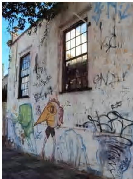
Figura 10 – Registro feito pela autora, 2012

Pode-se considerar ainda, em casos específicos, inscrições sobre a vida privada levada à esfera pública (Figura 11), crença na mudança, mostrando a identidade flexível (Figura 12) e tentativa de fugas dos padrões globalizados (Figura 13). As figuras são estêncis que também se repetem ao longo da rua. Utilizam frases curtas e irônicas, além de ícone da cultura pop.