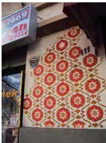
Figura 14 – Registro feito pela autora, 2012

A intervenção e a lógica de mercado convivem também na rua Trajano Reis, pois além de estar junto das placas e fachadas, alguns estabelecimentos comerciais utilizam do grafite para trazer o consumidor segmentado (Figura 14 e Figura 15).