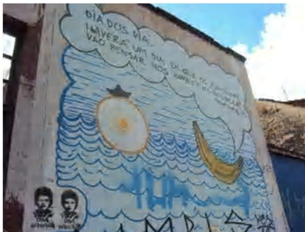
Figura 3 – Registro feito pela autora, 2012

uma criança, mantendo os erros de português, para deixar claro o contraste entre a simplicidade do narrador e a importância do que é dito. Os desenhos que completam a inscrição são voltados para a alimentação e o meio ambiente.